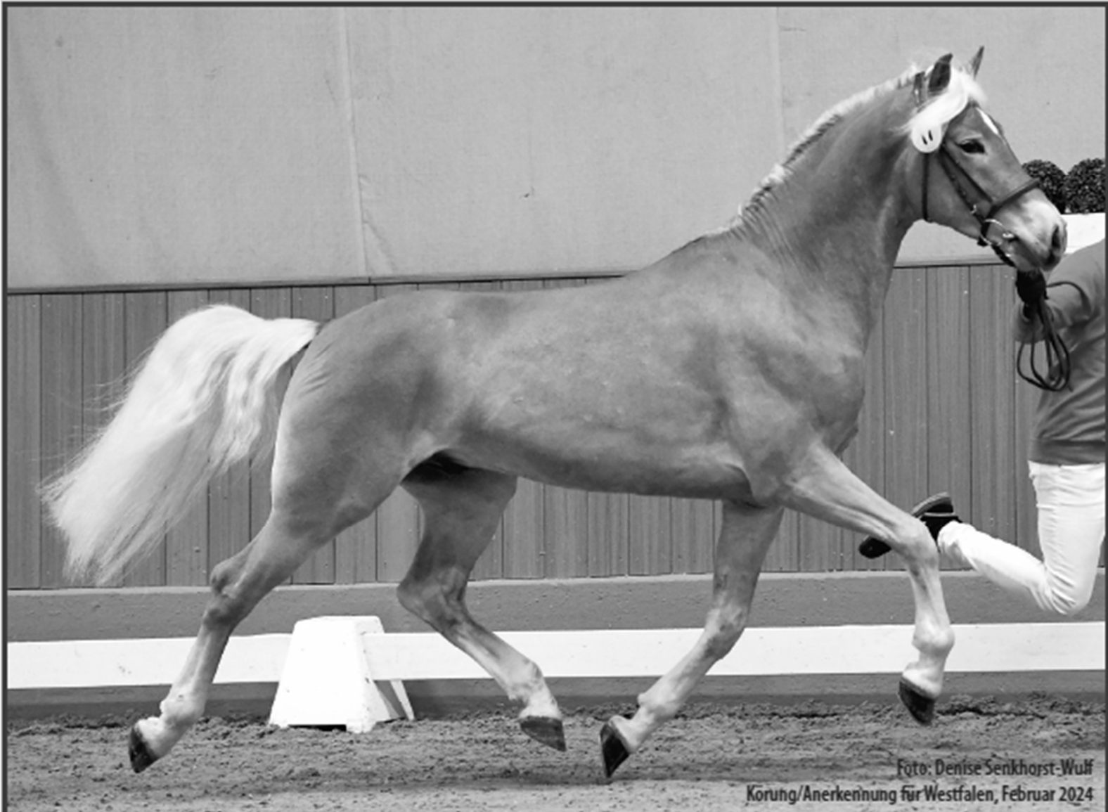
Körung/Anerkennung für Westfalen, Februar 2024

WONDER (W-GENERATION-C) *2019 MAESTRO *1994 • NOTRE BEAU *2007 MONET K *2012 • MAITRE *2008